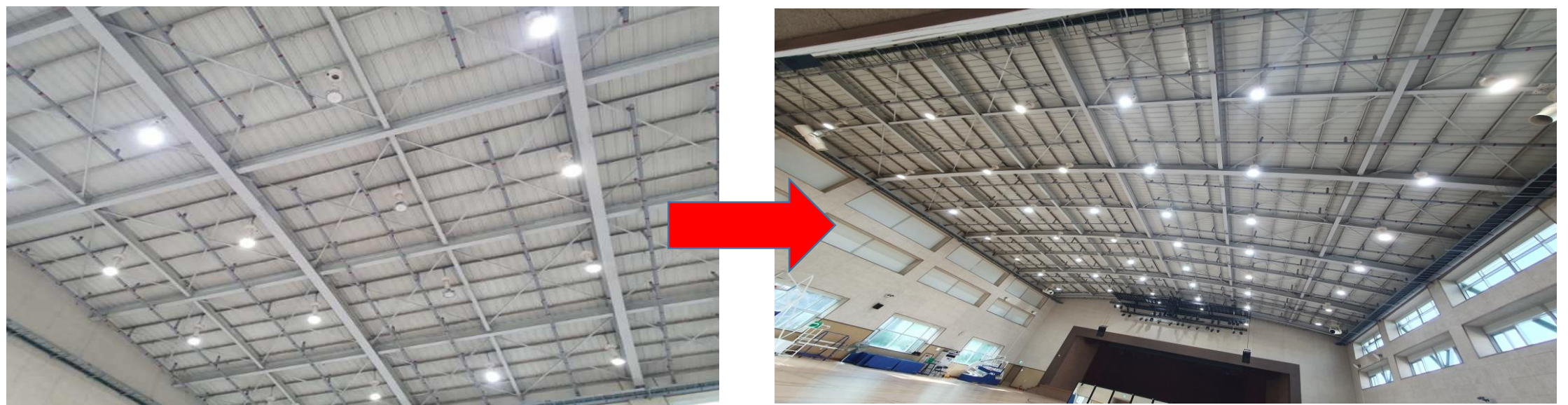
3층 다목적체육관 천장등 8개 교체 완료(5. 24.)