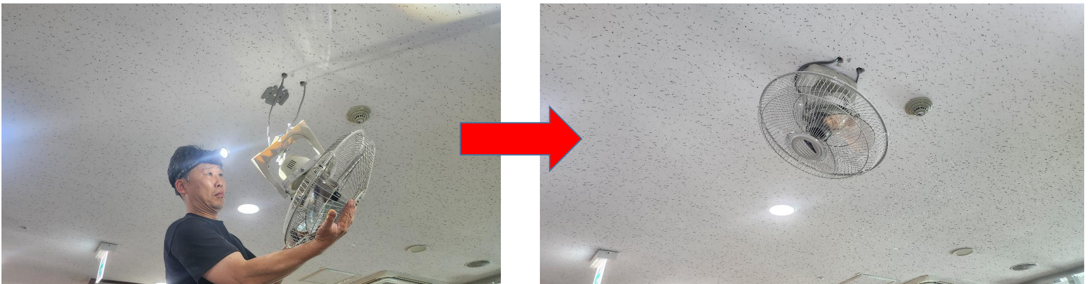
2층 관람석 선풍기 교체 완료(5. 10.)